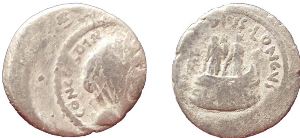
Figura 1 Denar L. Mussidius Longus 42 î.Hr.