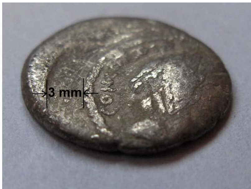
Figura 6 Rezultatul deplasării ștanței de avers

Faptul că ștanța de avers este deplasată față de cea de revers ne relevă un aspect legat de procesul tehnologic al baterii piesei, și anume grosimea matriței utilizate la baterea acesteia. Putem astfel să ne imaginăm dimensiunea ștanțelor. Baterea monedei cu matrița de avers deplasată a scos la iveală șanțul lăsat de către marginea ștanței de revers, lată de 3 mm, în pastila monetară. De pe revers am reușit să măsurăm și diametrul cercului perlat ce încadrează câmpul monetar, acesta fiind de 14 mm. Astfel denarul nostru a fost bătut cu o șanță având diametrul exterior de 20 mm și cel interior de 14 mm.